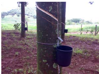
Abertura de Painel