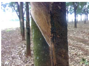
Perda de declividade