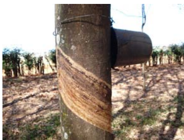
Sangria bem feita