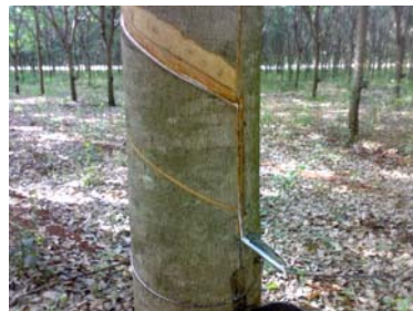
Abertura do painel