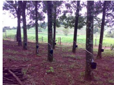
Abertura de painel