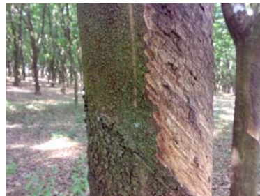
Falta de respeito à geratriz