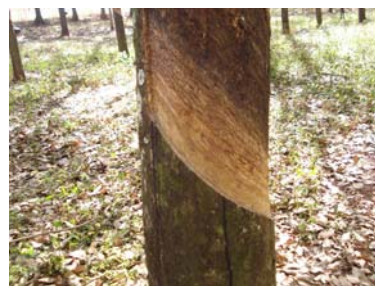
Bandelrar para corrigir declividade