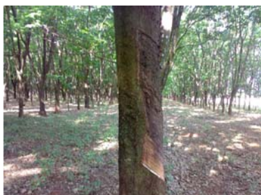
Ferimento e Geratriz