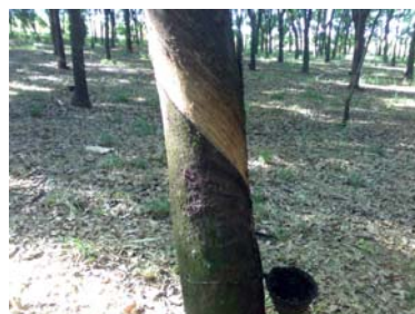
Declividade / Consumo de casca