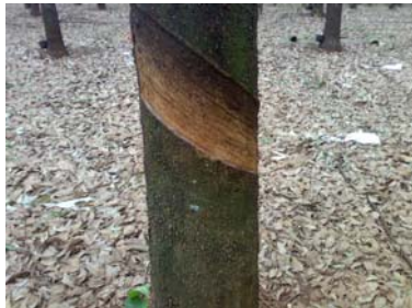
Sangria bem feita!