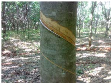
Abertura de painel