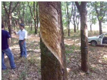
Perda de declividade e ferimentos