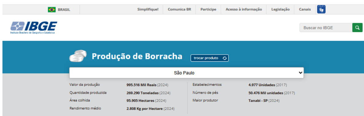
Mapa - Borracha - Valor da produção (Mil Reais) | exibir Tabela

No plano nacional, apesar dos esforços de produção interna, o Brasil ainda depende de importações para atender parte da demanda por borracha natural : em 2021, cerca de 76 % da borracha adquirida por usinas de beneficiamento eram importadas, majoritariamente de países asiáticos, segundo dados da Confederação da Agricultura e Pecuária (CNA).